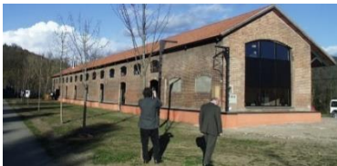
. Casas, J.(2016). Alberg públic de Sant Joan de les Abadesses [Fotografia]. Origen: http://www.elpuntavui.cat