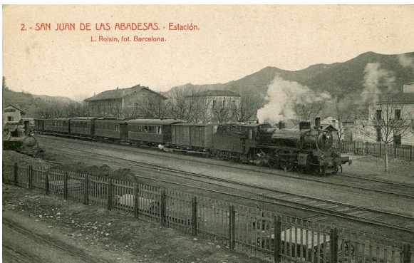
2. - SAN JUAN DE LAS ABADESAS. - Estación. L. Roisin, fot. Barcelona. . Roisin, L.(Any desconegut). Estació de Sant Joan de les Abadesses [Fotografia]. Origen: http://transpirenaico.iguadix.es