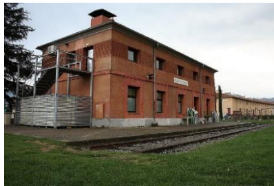
. Bassols, A.(2011). Estació de Sant Joan de les Abadesses [Fotografia]. Origen: http://www.ferropedia.es/